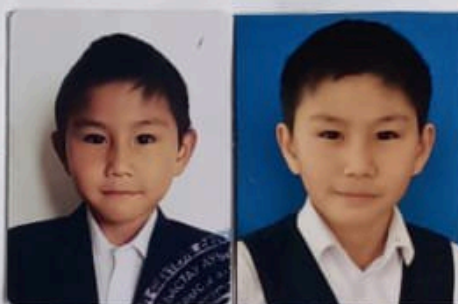
ФОТО 10-11 (12) сынып 10-11 (12) класс