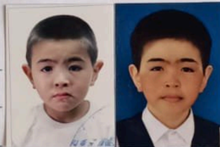
ФОТО 10-11 (12) сынып 10-11 (12) класс